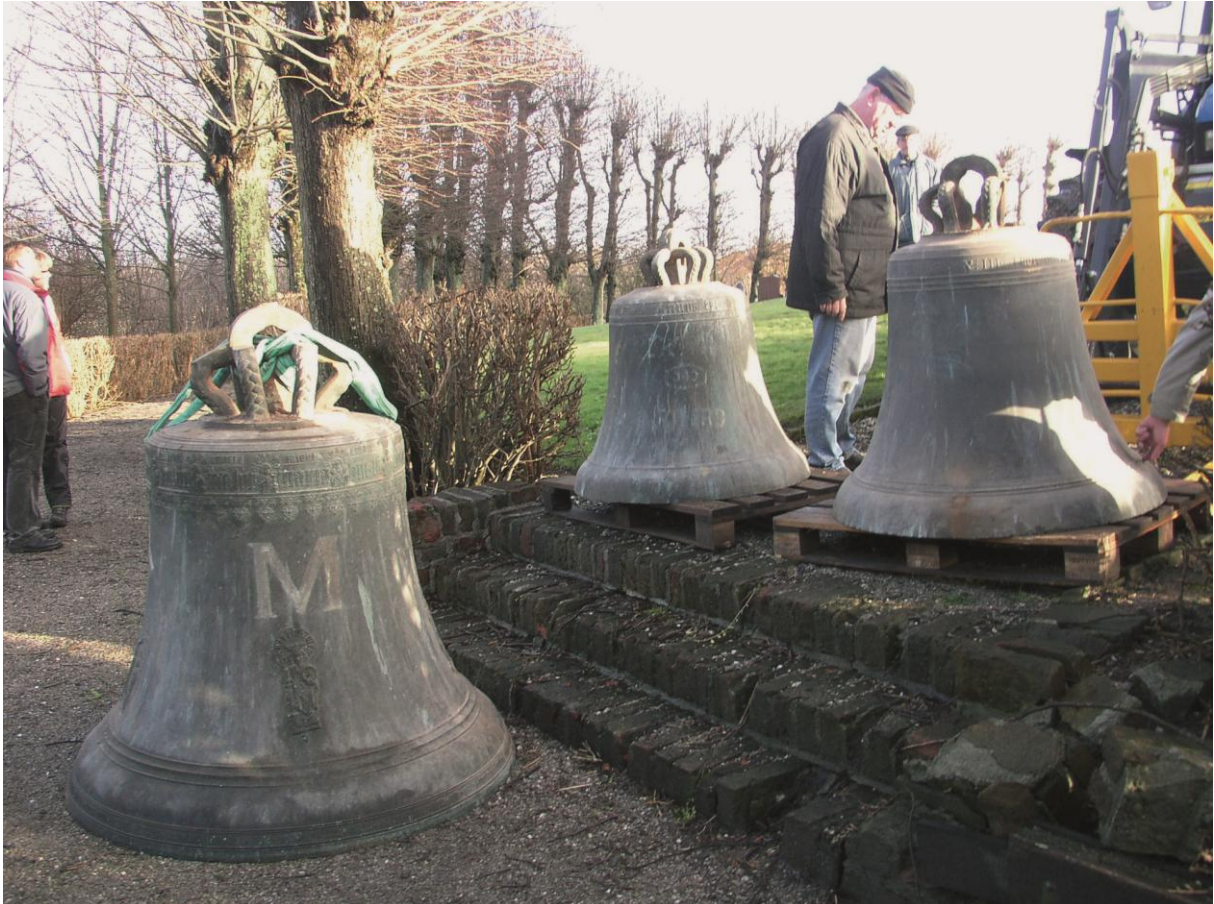
De klokken uit de toren gehaald voor restauratie in januari 2004.

In de loop van het jaar 2002 bleek dat de klank van de klokken zodanig veranderde in negatieve zin dat een inspectie nodig was. De oorzaak was dat er scheuren in de klokken ontstaan waren. Dit was zo ernstig dat bij de jaarwisseling 2002/2003 koster Jan Hilverda de klokken niet meer kon luiden. Het college van Kerkrentmeesters nam contact op met de Stichting Behoud Kerkelijke Gebouwen en er werd een plan van aanpak vastgesteld. Zodoende werden in januari 2004 de klokken uit de toren gehaald en naar de firma Lachenmeyer in het Duitse Nördlingen getransporteerd voor restauratie. Ook de klokkenstoel werd gerestaureerd. In de maand November kwamen de klokken weer terug. Op 18 december 2004 vond een feestelijke ingebruikneming plaats.